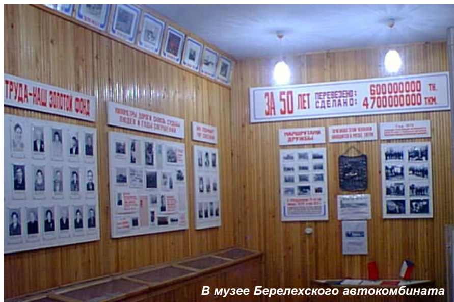
В музее Берелехского автокомбината

- Только хорошее. Несмотря на то, что многие специалисты уехали, перешли в другие структуры, коллектив предприятия – опытный, работоспособный, профессиональный, успешно справляется с поставленными